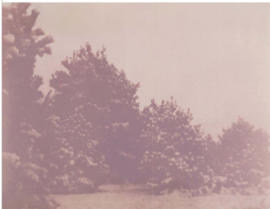
Het boek vraagt je om elke foto zo veel mogelijk als een complete onbekende te ontmoeten en te ontdekken.