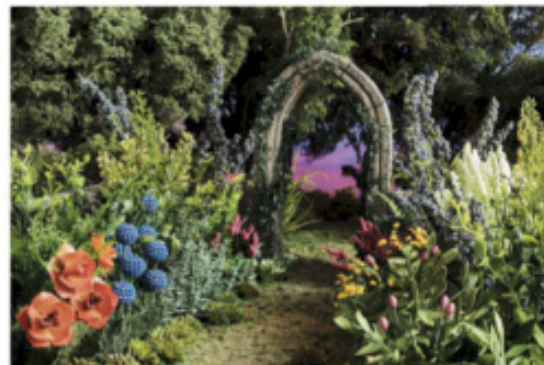
Winter garden, 2007.